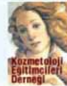
Kozmetoloji Eğitimcileri Derneği