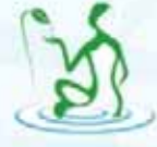
Masaj ve Doğal Terapiler Derneği